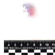
Дистанция 50 см

Следует отметить, что при проведении отдельных экспертиз, связанных с применением травматического оружия комплекса «Оса, Стражник», помимо